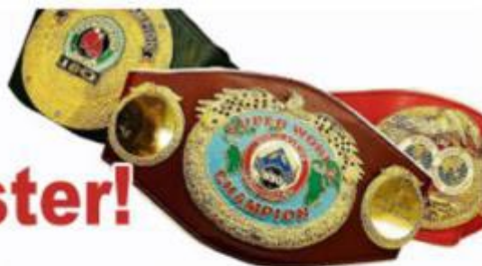
Bild Klitschkos eröffnen Gürtel- Geschäft